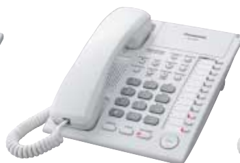
■ KX-T7720 Unidad con Altavoz