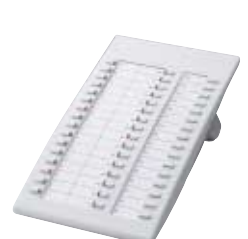
■ KX-T7740 Consola DSS