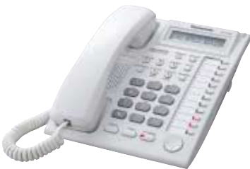
■ KX-T7730 Unidad con LCD y Altavoz

Llame a su tienda o empresa telefónica para confirmar que el servicio de Identificador de llamada existe en su región.